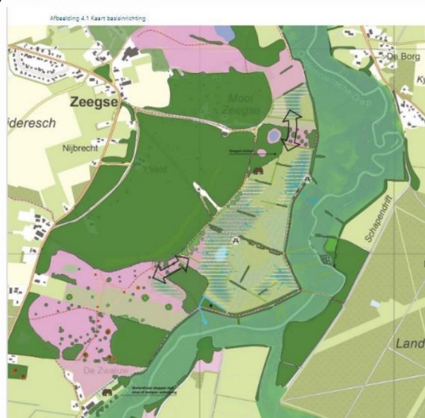
1kaart Inrichtingsplan (wordt nog vervangen door actuelere versie in plan 24 aug. )