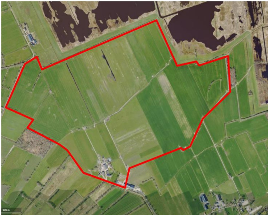
Figuur 1, bejagingsgebied