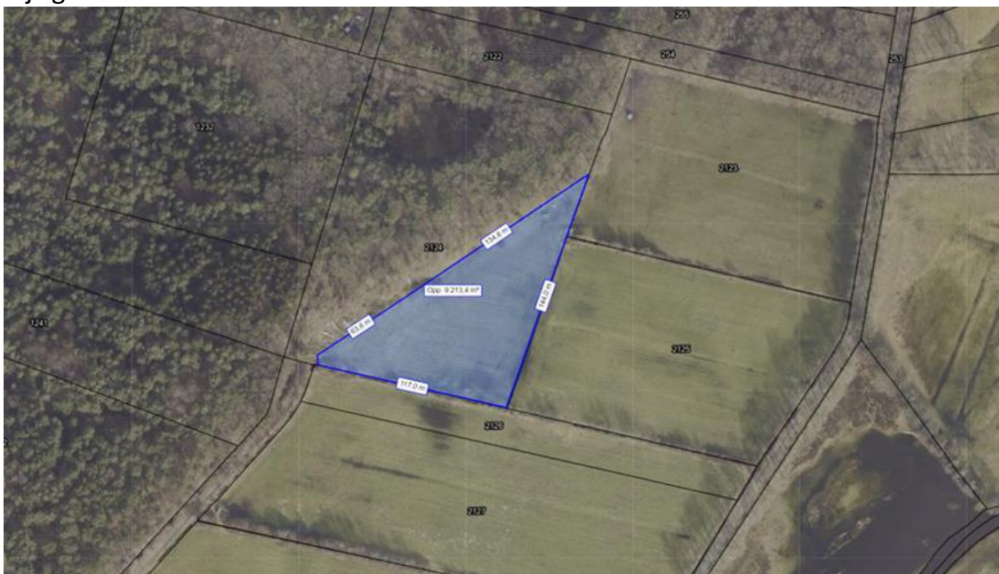
Omvang bos/ gras op kadastraal perceel 2124