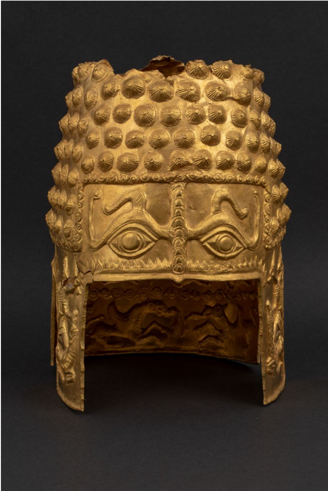
Helm van Coțofenești, c.a. 450 v. Chr., National History Museum of Romania.