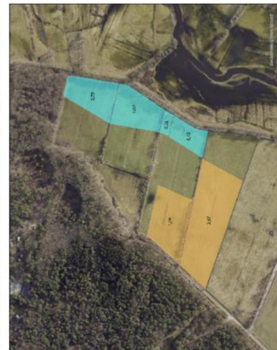
Roodzanden te taxeren percelen