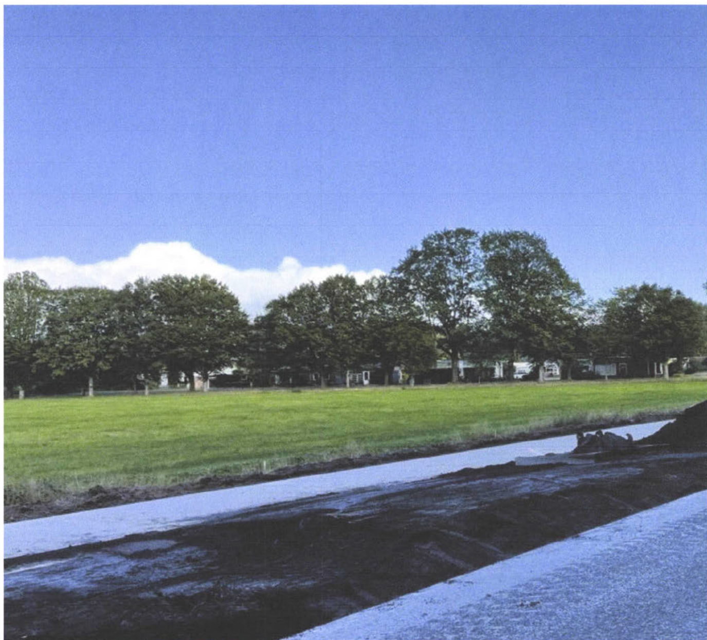
De kaalslag aan de Norgeweg in Roden roept veel vragen op © RTV Drenthe [REDACTED]

Flinke kaalslag aan de provinciale weg tussen Roderesch en Roden leidt tot gefronste wenkbrauwen bij omwonenden. Maar het kappen van 35 bomen heeft een goede reden, laat de provincie Drenthe weten. De bomen zijn namelijk verzwakt en leven hooguit nog een jaar of vijf.