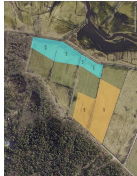
Roodzanden eigendommen Aanbesteding 0 25 50 100 meters