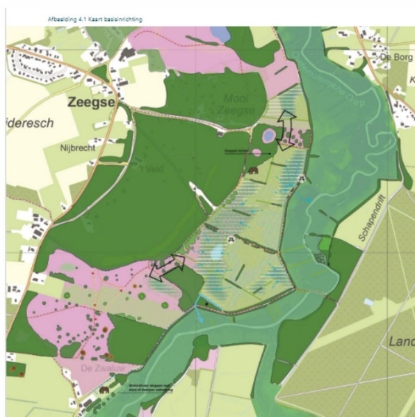
1kaart inrichtingsplan (wordt nog vervangen naar meest actuele kaart)