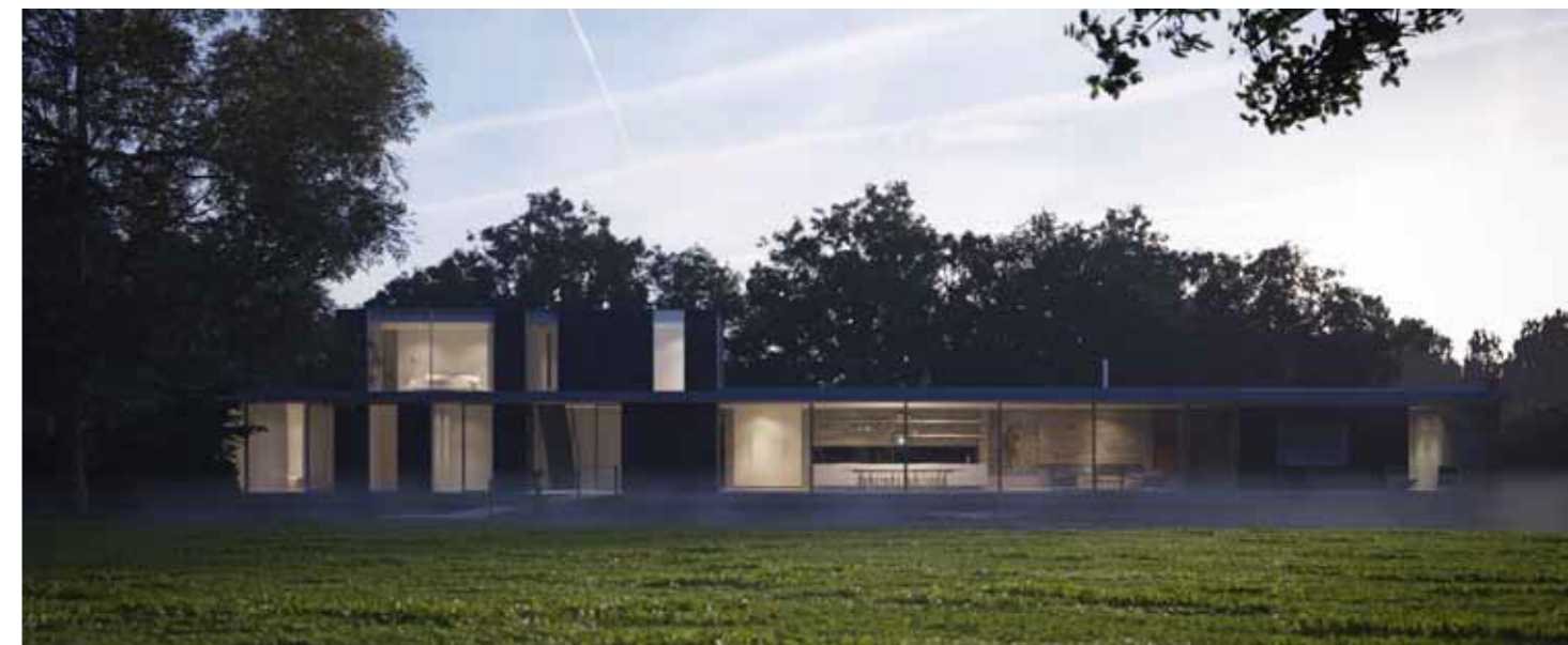
Sfeer villa breuksteen - beton - hout B1040, Nieuw wonen Terhijlsterweg, versie 08