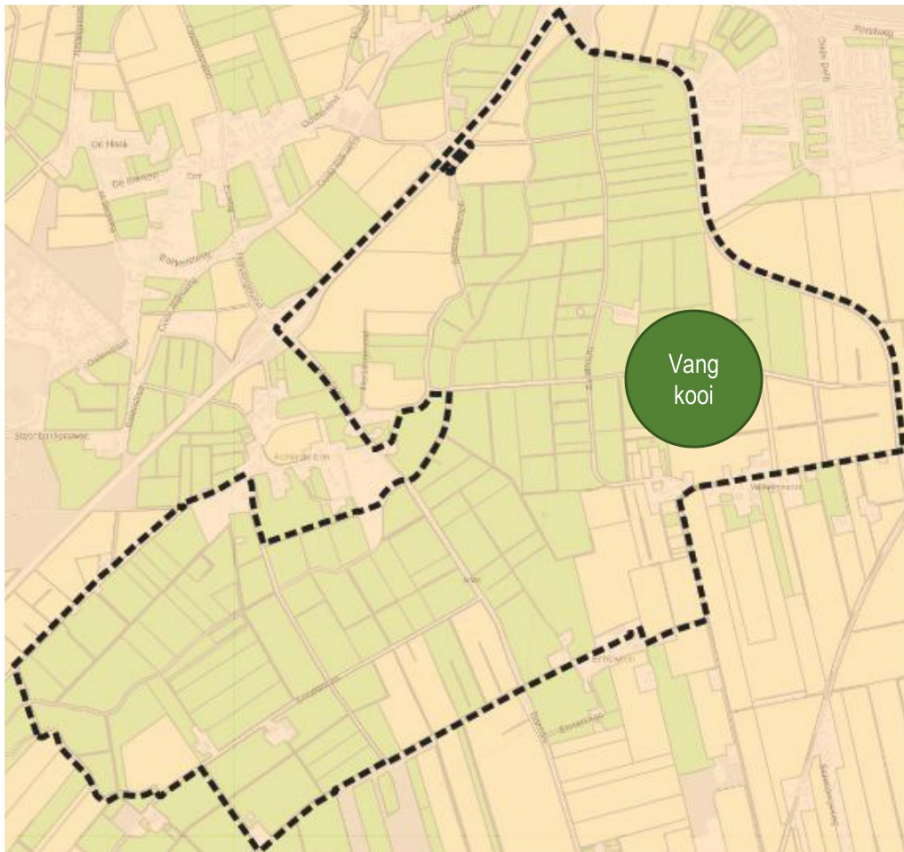
Figuur 4 Kaart ligging vangkooi(en) WBE Bargerveld