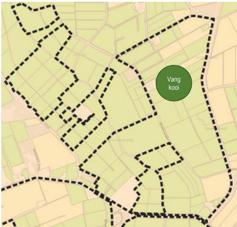
Figuur 3 Kaart ligging vangkooi(en) WBE Mars & Westerstream