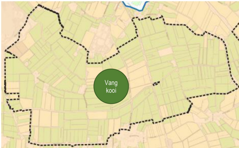
Figuur 2 Kaart ligging vangkooi(en) WBE Kerspel Dalen