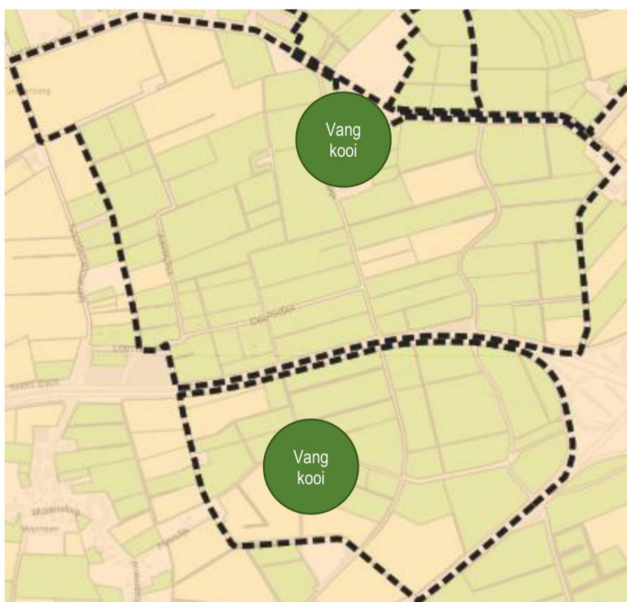
Figuur 1 Kaart ligging vangkooi(en) WBE Kerspel Dalen